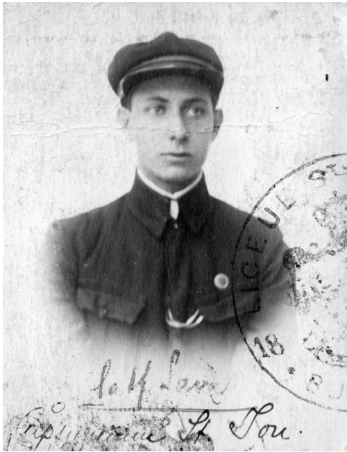
Ion Căpșuneanu, 1917