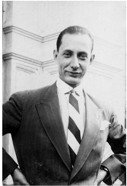
Ion Căpșuneanu, anii 1920