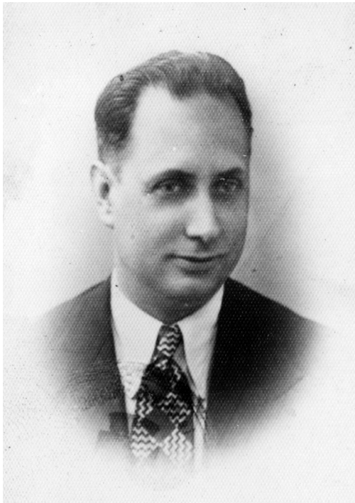
Ion Căpșuneanu, anii 1940